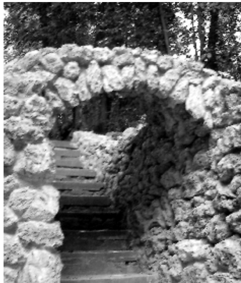
L'archetto come appare dopo il rifacimento del 2009, senza i tipici mattoncini romani che circondavano la sua imboccatura