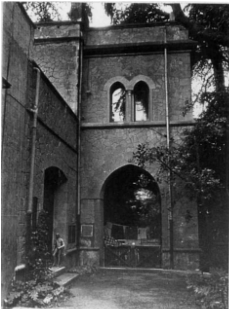
Uno scorcio del Palazzo di Strohl-Fern durante la seconda guerra mondiale occupato dagli sfollati a Roma