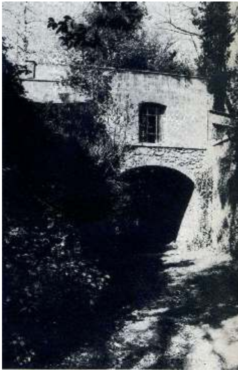
Lo studio di Rilke

detta dal suo utilizzo come scuola, e di conseguenza in molti, e continuamente, accedono alla Villa. Non può nemmeno dirsi, però, che essa sia realmente e quotidianamente “visitata”, perchè i percorsi che vi si fanno sono quelli un po' ripetitivi di chi va e viene dalle classi, dagli uffici scolastici. È, insomma, malnota al grosso dei cittadini perchè la sua storia non è abbastanza antica per reggere il confronto, nella conoscenza popolare, con i siti millenari di Roma, e al contempo essa non gode della notorietà che hanno le Ville romane, che, dal momento della loro apertura al pubblico dopo le insigni ascendenze gentilizie, sono indiscutibilmente i luoghi maggiormente amati e sentiti come propri. Perfino il suo nome straniero, composito e in parte di