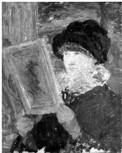
Édouard Manet (attribuito a) La Lecture , 1881, olio su tavola, cm 41x32,5, recto e verso