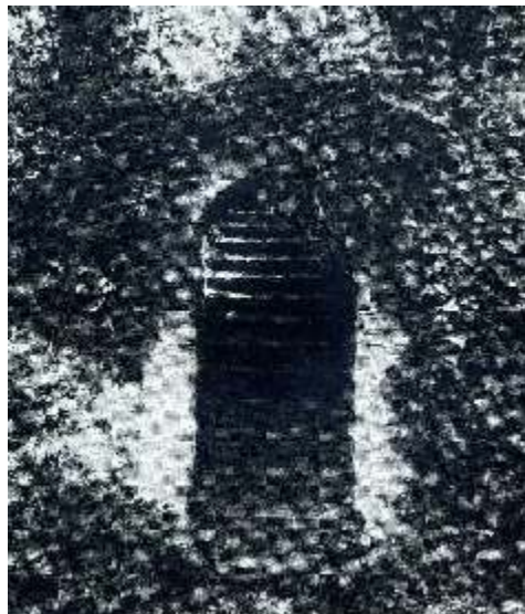
L'archetto vicino alla casa di Rilke, con la caratteristica rifinitura di mattoncini romani, ancora integro fino agli anni '70

Tra il 1973 e '75, con l'intenzione di creare un nuovo ingresso carrabile alla Villa, venne ripristinata una vecchia strada di accesso alla collina, costruita durante la difesa di Roma 1848, con l'ingresso al n. 11 del piazzale di Villa Giulia. Durante i