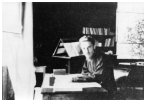
Rainer M. Rilke