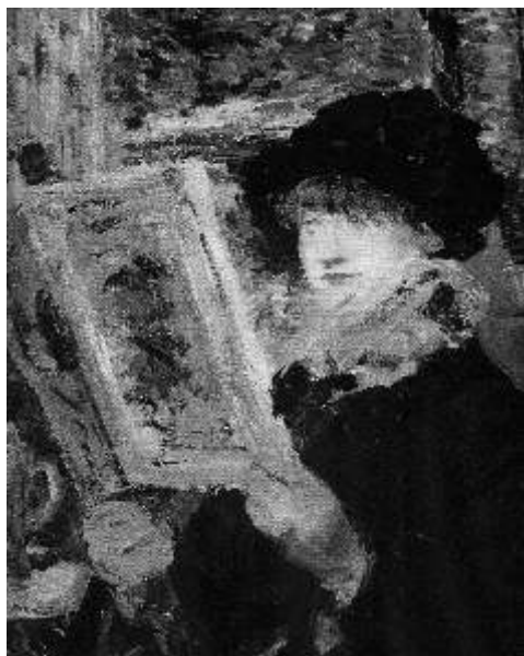
Édouard Manet, La Lecture , 1879ca, olio su tela, cm. 61 x 50