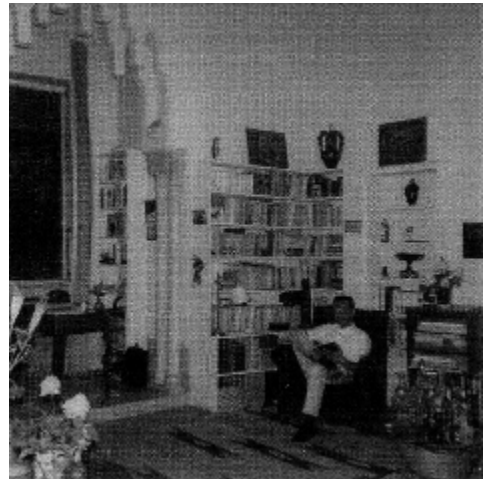
Lo scrittore P. M. Villa nella “sala moresca” al piano terreno del palazzo di Strohl-fern, 1950 c.