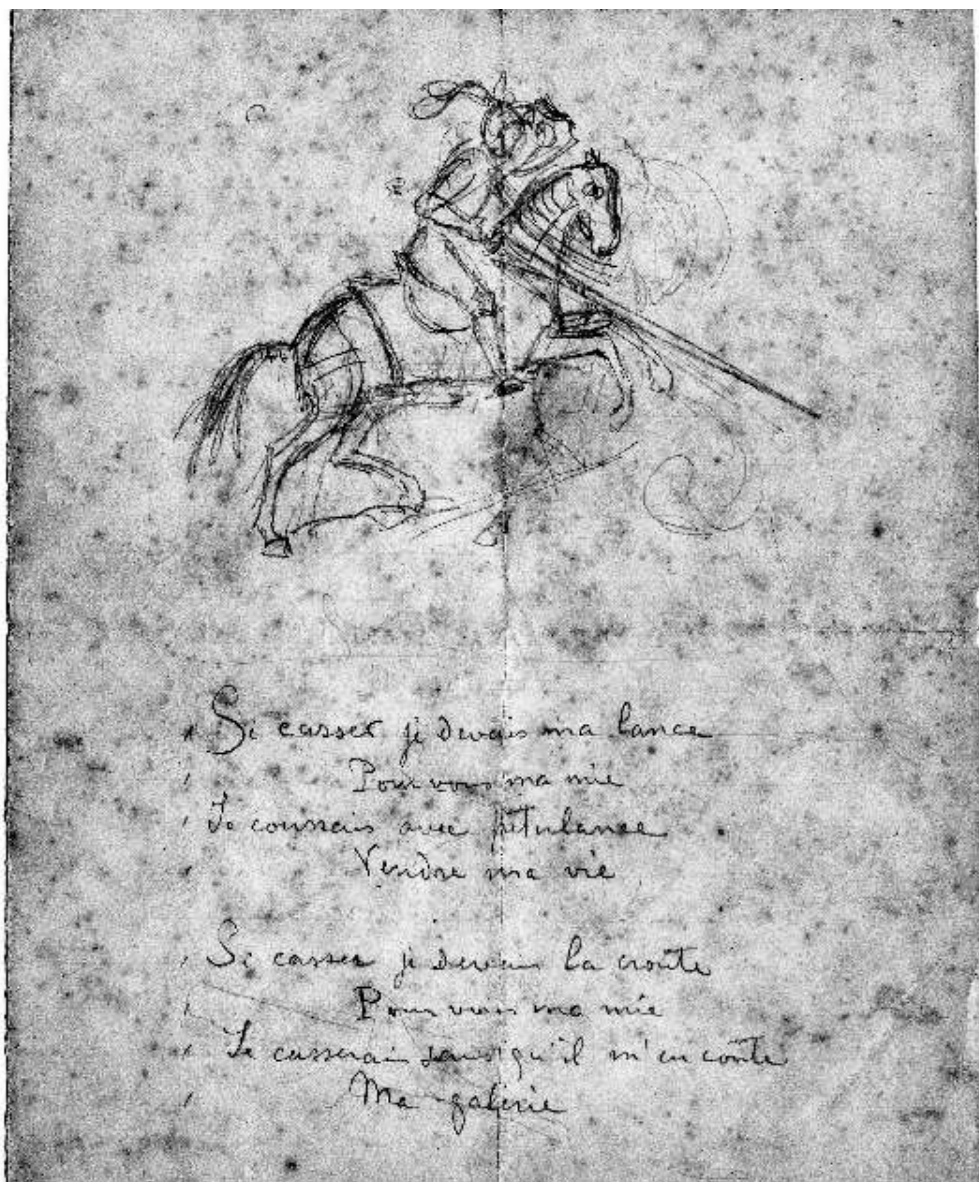
Alfred Strohl-Fern, Si casses je [...] s.d. matita su carta 226 x 179 mm