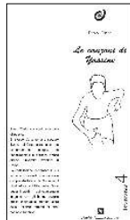
Le canzoni di Yassine