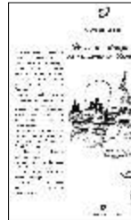
Vorei 'na stanza co' la vorta a bbotte