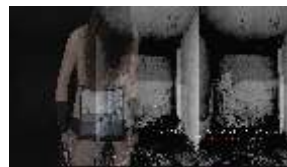
CARLA PAIOLO ARCHAEO_LOGICAL TRANSFER - 2012 Stampa fotografica su forex 50 X 100 cm