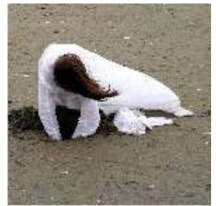
FRANCESCA RACHELE ILI COMING BACK - 2010 Still da video Dimensioni variabili